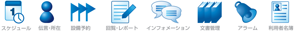
英語 - スケジュール -

スケジュール、伝言・所在、設備予約、回覧・レポート、インフォメーション、文書管理、アラーム、利用者名簿の基本8機能が言語切り替えに対応しています。またその他標準16機能についても、日本語インターフェースにてご利用頂けます。